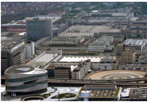
Usine de Mercedes, en bordure de Stuttgart