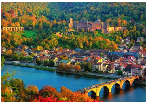
Heidelberg, ville de conte de fées et centre majeur de recherche et de formation

Dossier de préparation au voyage d'étude de l'IHEDATE Promotion 2012