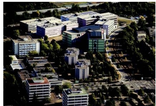
Parc technologique d'Heidelberg