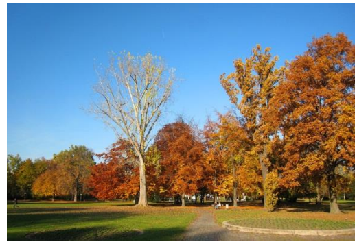
Jardin du château de Stuttgart, futur lieu d'un projet controversé d'expansion de la gare